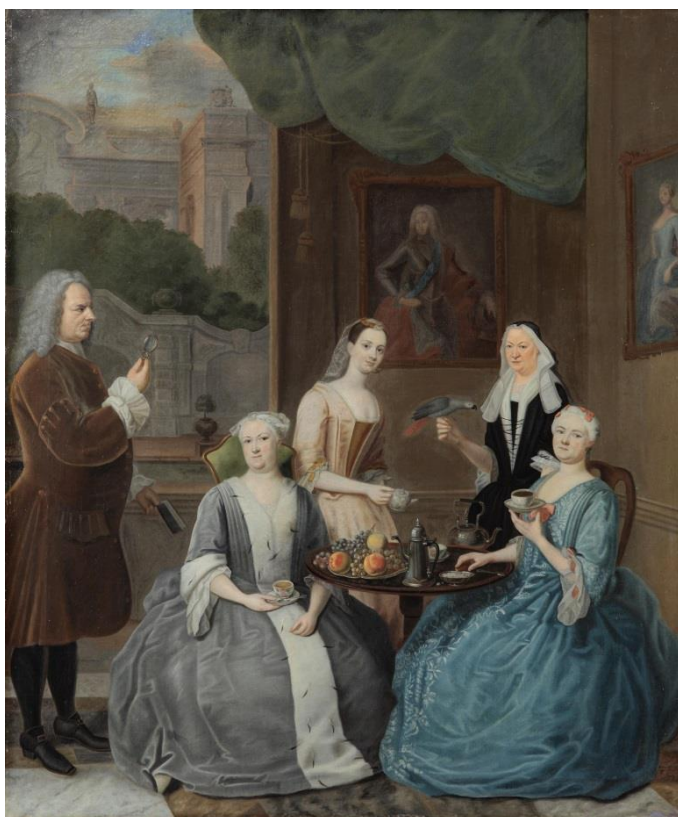
Balthasar Denner, Teselskab hos hertuginde , 1732, olie på lærred