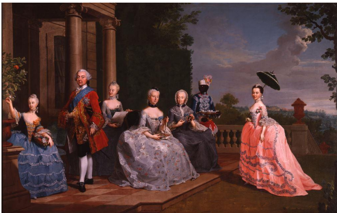
Johan Heinrich Tischbein, Den plöenske hertugfamilie, 1759, olie på lærred