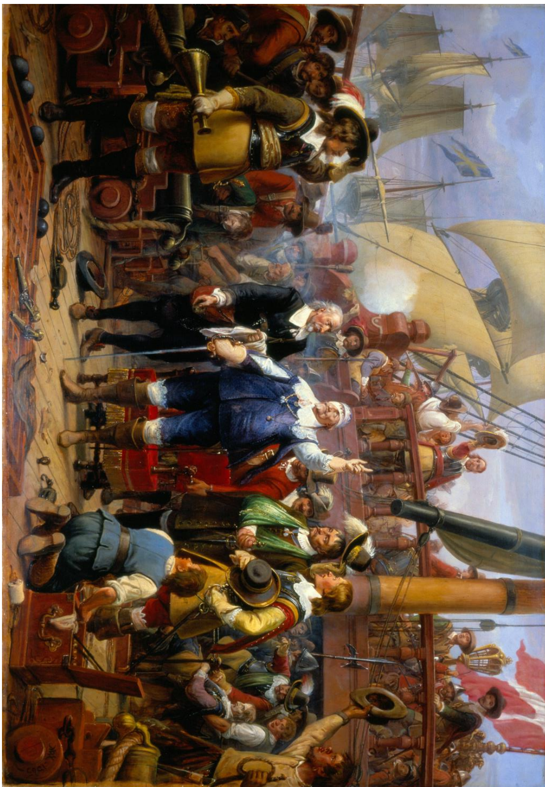
Bilag 3: Billede af Marstrands maleri af Chr. 4. ved højen mast.