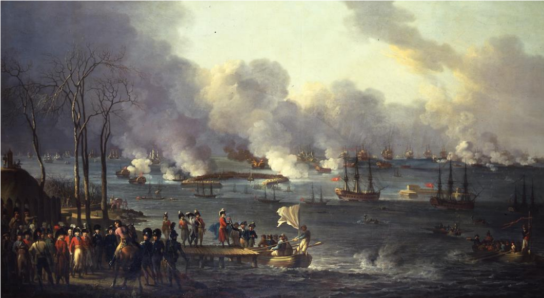
Den engelske parlamentær går i land under Slaget på Reden. Maleriet viser afslutningen på slaget omkring klokken 15. En britisk officer rækker et brev til en dansker. Brevet indeholder et tilbud om våbenstilstand. Kronprins Frederik (6.) ses i venstre side af billedet. Han står sammen med sine militære rådgivere. Malet af Christian August Lorentzen i 1802.

Billeder kan også bruges som kilder til at forstå historien. Herunder ses to billeder. C.A. Lorentzens maleri af Slaget på Reden 1801 og C. W. Eckersbergs maleri af Københavns bombardement 1807 er begge malet umiddelbart efter, at begivenhederne fandt sted.