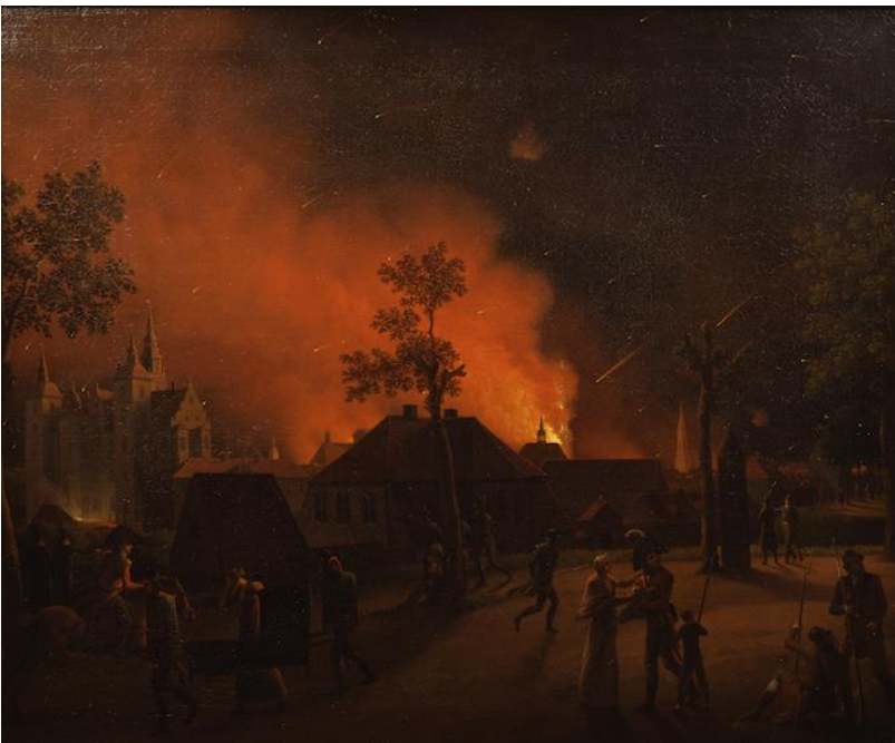
Københavns bombardement set fra volden ud for Rosenberg Slot. Himlen oplyses af kongresske raketter, og Vor Frue Kirkes tårn er i brand. En bombe eksploderer i forgrunden og oplyser scenen, hvor en officer er ved at bringe sin familie i sikkerhed. Derudover kan man bl.a. også se en mand på en bære fulgt af en kvinde. Maleriet er malet af Christoffer Wilhelm Eckersberg i 1807. Eckersberg var selv til stede i København under bombardementet.